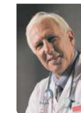
Pr Alain Deloche Fondateur