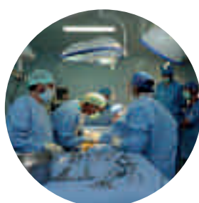
Le bloc opératoire

• 4 blocs opératoires (3 salles d'opérations et 1 salle d'endoscopie), unité de soins intensifs (salle de réveil, salle de réanimation, couveuses...) et une salle de stérilisation centrale .