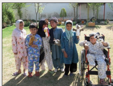
Les enfants d'Afghanistan