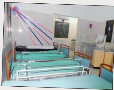
Nouvelle unité de soins pour les enfants brûlés au Togo