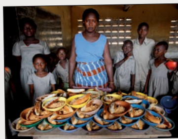
La nouvelle cantine d'Adjallé, Togo